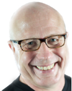
PLUS EBERHARD LIZENZIERT FÜR STRUCTOGRAM® UND TRIOGRAM®

Seminare für die persönliche Entwicklung